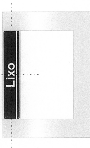
2 LIXEIRA DE PLATAFORMA - VER PP 9.00.00.00/9B7 - 006